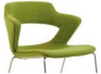
ALL UPH intégralement revêtue