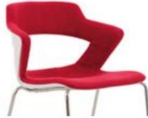
FRONT UPH dos et assise revêtue