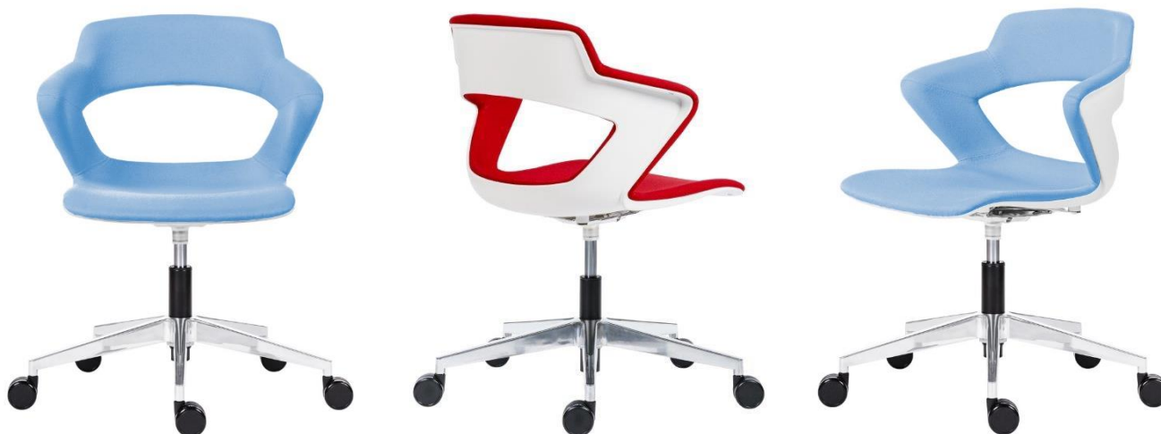
FAUTEUIL DESIGN VERSION STYLE Référence KAOMA216oALU