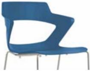
PLAST plastique intégral