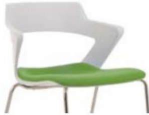
SEAT UPH assise revêtue